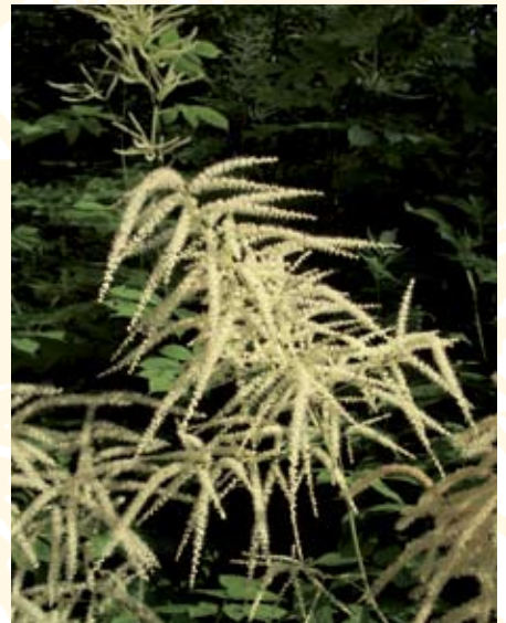
Wald-Geissbart ( Aruncus dioecus )