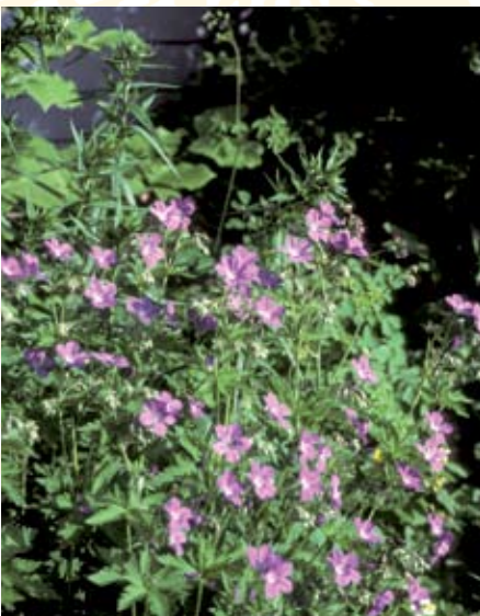
Wald-Storchschnabel ( Geranium sylvaticum )