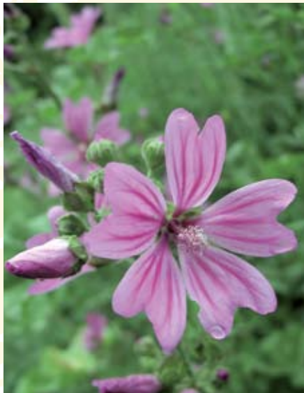
Wilde Malve ( Malva sylvestris )