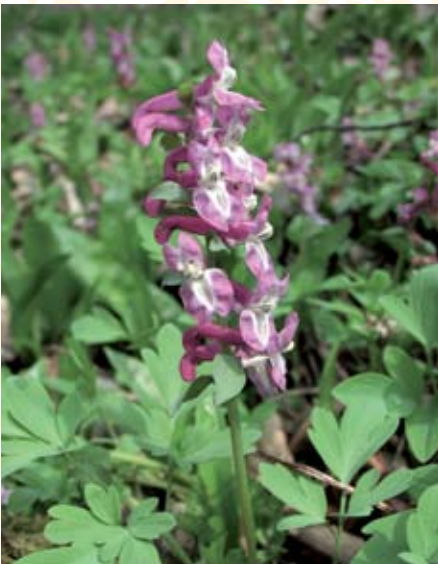
Hohlknolliger Lerchensporn ( Corydalis cava )