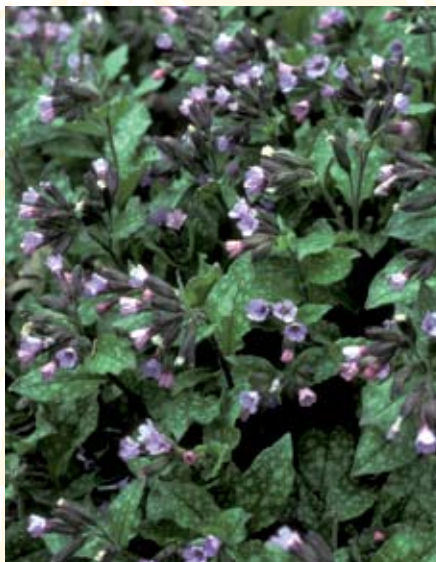
Lungenkraut ( Pulmonaria officinalis )